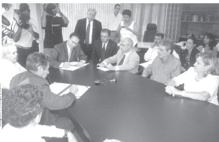
Administração municipal repassará recursos da ordem de R$ 1,5 milhão ao Evangélico