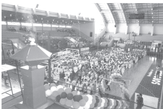
Cerimônia de abertura reuniu alunos e professores das 44 escolas participantes

Como em toda cerimônia de abertura de uma competição esportiva, um dos momentos mais emocionantes e muito aguardado por todos os atletas, foi o