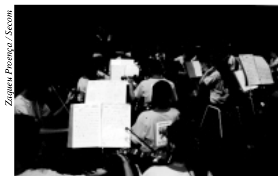
Orquestra do Projeto Guri celebrará o 10º aniversário do programa no Estado.

Os cursos são oferecidos gratuitamente na Oficina Cul-