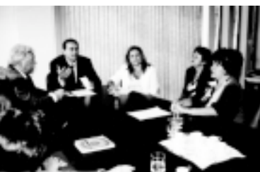
A reunião ocorreu no gabinete do prefeito Vitor Lippi

timas de violência sexual são atendidas pelos serviços prestados através do Protocolo de Ações Integradas em Atendimento à Vítima de Violência Sexual (PAI), que foi premiado nesta quarta-feira (23) pelo governador Geraldo Alckmin. O prêmio reconhece anualmente as melhores práticas de gestão pública em nível estadual.