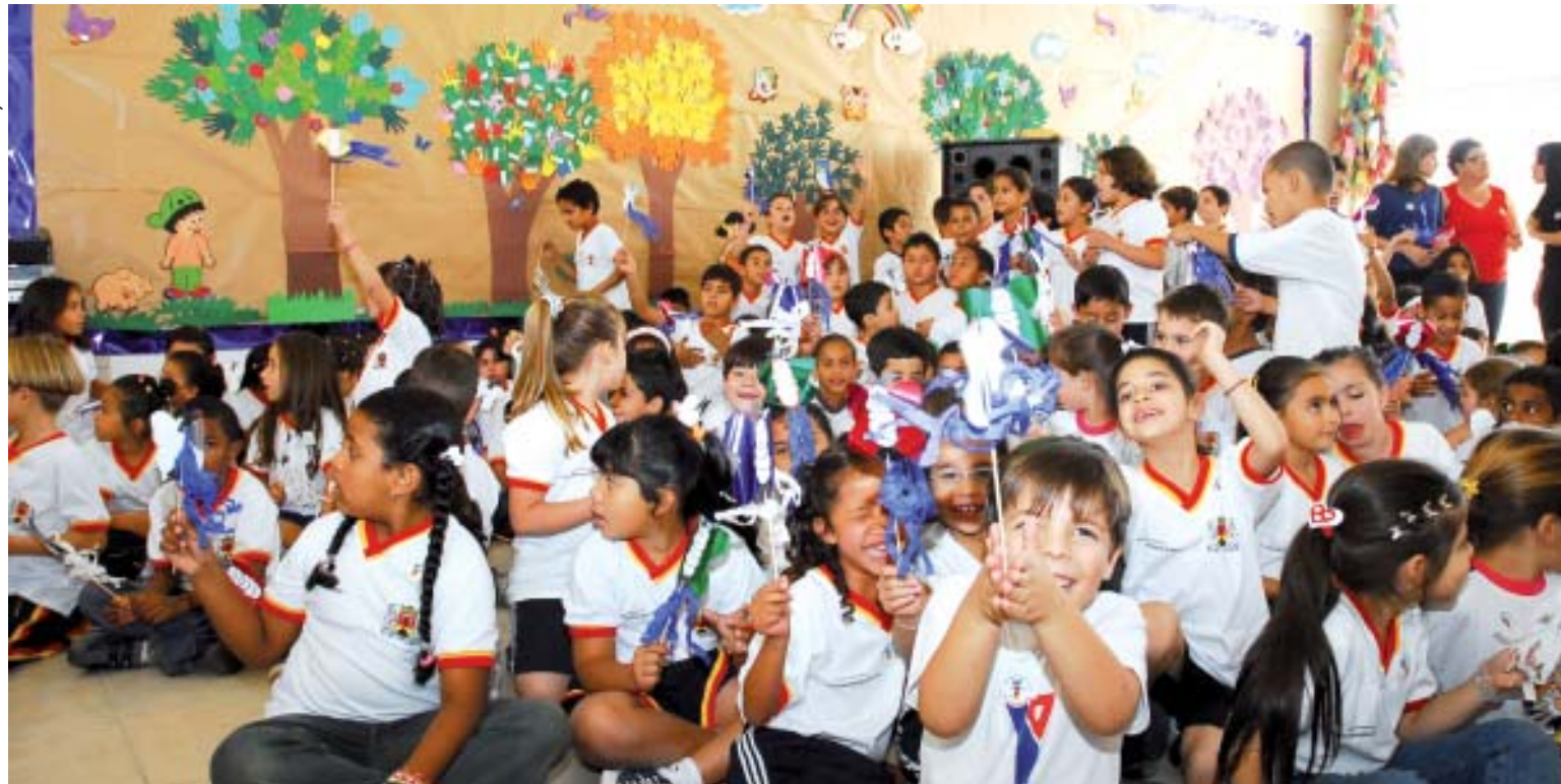
Paulo Ochandío / Secom

O Teatro será utilizado também pela comunidade e classe artística. O local dis-