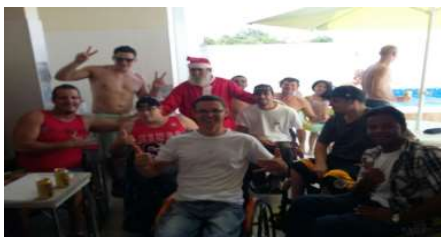
FESTA JUNINA 2016