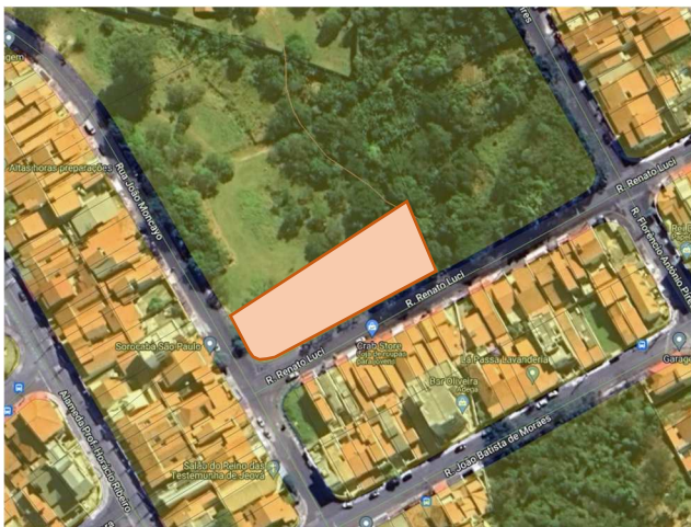
Rua Renato Lucci – Jd. Martinez

Art. 1º CONVIDAR a comunidade vizinha da área pública situada à Rua Renato Lucci – Jd. Martinez e da área pública situada à Rua Paulo Varchavtchik – Cond. Arte de Viver, para comparecer a essa Secretaria da Habitação e Regularização Fundiária (SEHAB), no dia 24 de fevereiro de 2023, às 16:00, no prédio da secretaria, Rua Souza Pereira, nº 448, Centro (Palacete Scarpa), com a finalidade de apresentar e debater sobre a proposta da Prefeitura de Sorocaba para as áreas institucionais a serem desafetadas.