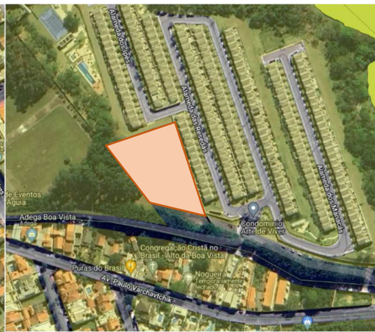
Av. Paulo Varchavtchik – Cond. Arte de Viver